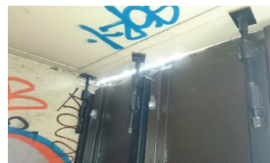
Amovibilité des panneaux pour passage d'engins de travaux