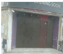
Salle de théâtre