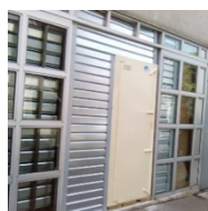
Exemple panneaux murs sur 18m 2