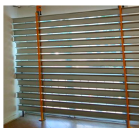
Exemple Asgard sur deux étais 6m 2